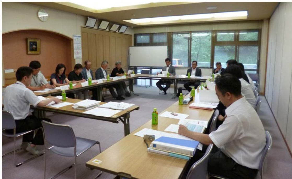
15名の専門委員の皆さん