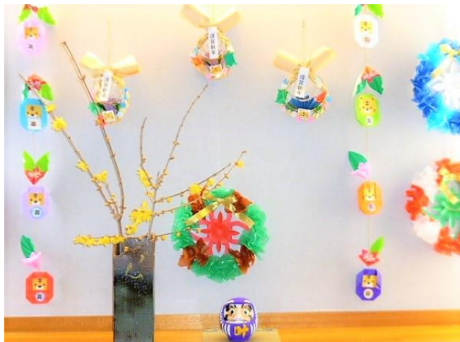
▲「2022お正月飾り」 老人福祉センターの廊下に飾ってあります。