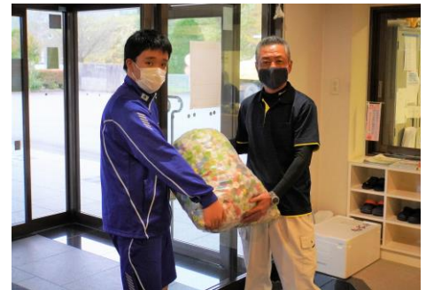
▲長野原高校代表の生徒さん（写真左）より、たくさんのおペットボトルキャップが手渡されました。

地域の皆様よりたくさんのおペットボトルキャップを提供していただき、昨年もたくさん集まりました。 10kgでポリオワクチン1人分としての寄付を行うことができます。またゴミとして焼却すると1kg約3,150gのCO 2 が発生してしまうため、リサイクルすることによりCO 2 削減を実施することもできます。