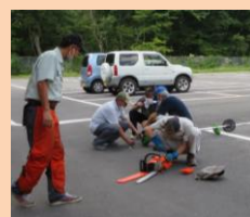
安全適正就業講習会の様子

シルバー人材センターは公益団体として、高齢者の知識や経験を活かし、地域社会に貢献する事業です。