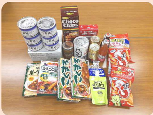
△ 頂いた食料品の一部

福祉に対するあたたかい心をありがとうございます。地域福祉のため有効活用させていただきます。 (令和六年四月一六日〜六月三〇日)